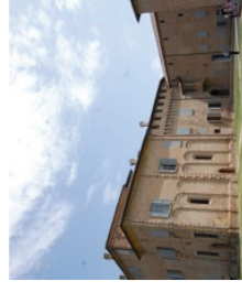
San Martino in Rio